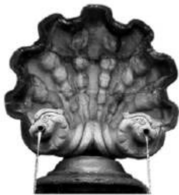
Figura 3 – Carranca do chafariz dos Contos.