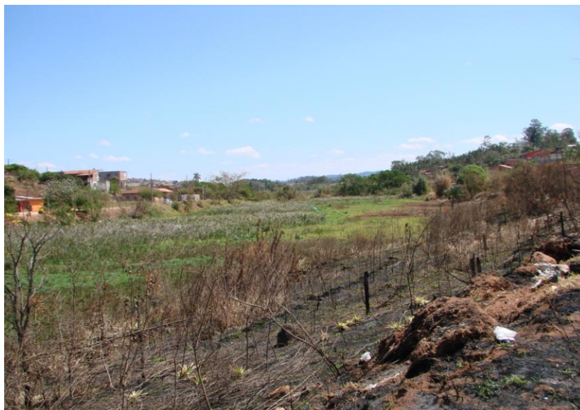
Figura 3 – Imagem de lago de pequeno barramento assoreado visto de montante para jusante, em função da urbanização da bacia de contribuição.