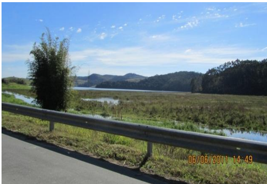
Figura 5 – Lago da barragem de Paraitinga.