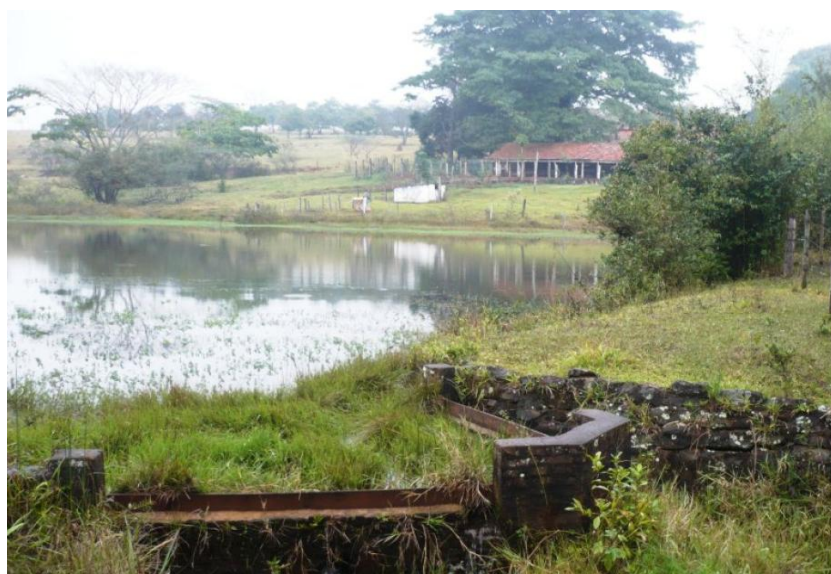
Figura 4 – Barragem Gallerani.

No município de São Manuel-SP, a barragem Gallerani é outro exemplo de barragem que sofreu processo de assoreamento associado à mudança de uso de sua bacia. Na bacia de montante havia plantação de eucalipto e ocorreu a mudança para pasto.