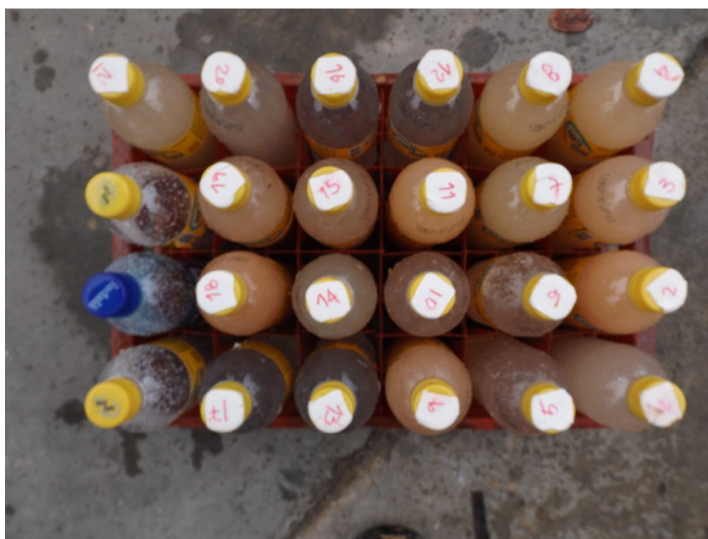
Figura 04, amostras serão colocadas em garrafas plásticas.

Em campo, o procedimento de coleta dos dados será baseado em anotar, após a ocorrência de uma chuva natural, a altura do nível de água de cada coletor. Em seguida, será homogeneizada manualmente o material erodido (água + sedimento) e retirava-se dele 1 amostra alíquota de 500mL. Como se apresenta na figura 04.