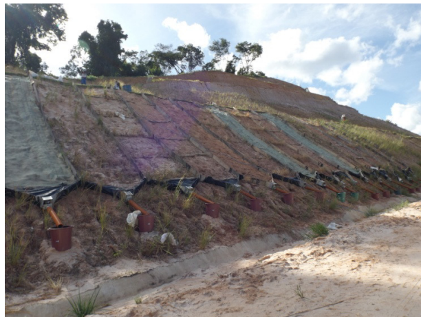
Figura 02, Talude do experimento com parcelas implantadas.

Para o experimento foram selecionados sete tipos de parcelas com três repetições, as parcelas foram construídas no talude do Centro de Logística da Compesa, situado no bairro da macaxeira, vizinho ao terminal integrado da macaxeira. Na implantação do experimento as parcelas utilizaram diferentes tipos de coberturas: (1) retentores de sedimentos; (2) biomanta de sisal; (3) capim Vetiver Vetiveria zizanioides L (Nash), casualizado; (4) capim Vetiver, Vetiveria zizanioides (Nash), em placas na horizontal; (5) retentores de sedimentos com capim Vetiver Vetiveria zizanioides L casualizado; (6) retentores de sedimentos e capim Vetiver Vetiveria zizanioides L em placas horizontais; (7) solo sem cobertura vegetal ou solo desnudo. (Figura 02).