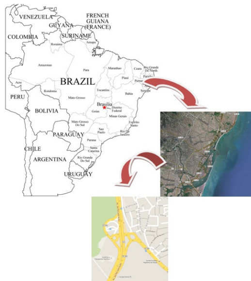
Figura 01 - — Localização geográfica e delimitação das áreas de estudo.